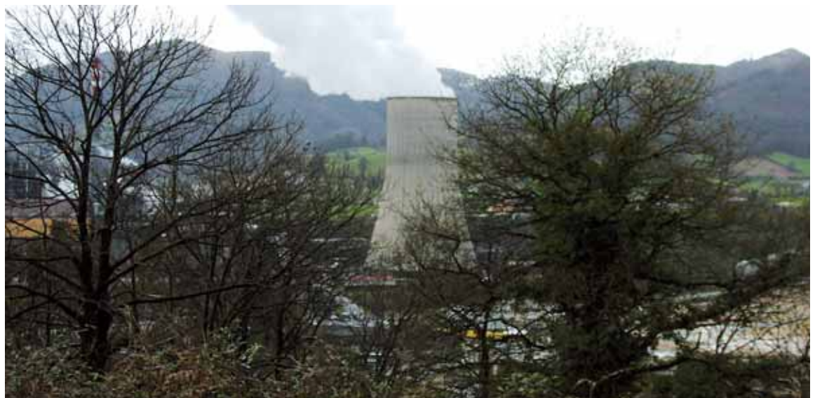
Páginas 2 y 3 Central térmica de Soto de Ribera con la sierra del Aramo de fondo